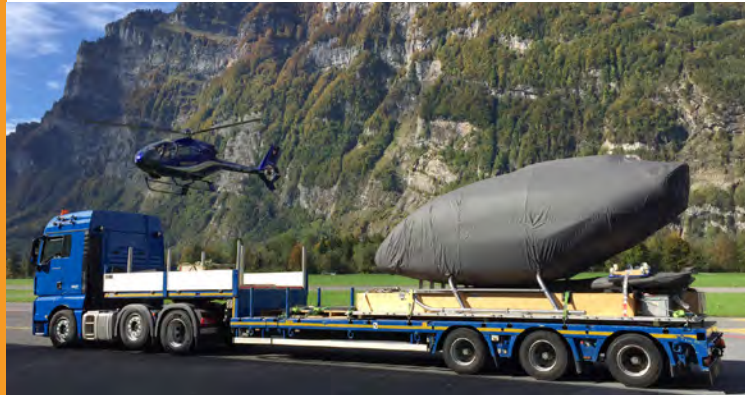
Spezialtransporte sind unser Fachgebiet

Durch unsere grosse Flotte und Infrastruktur von Solofahrzeugen, Sattelschlepper, Auflieger mit 1-, 2- und 3-Achsen sowie Fahrzeuge mit Mitnahmestapler, Hebebühnen und Kranen, haben wir für jede Anforderung das passende Fahrzeug.